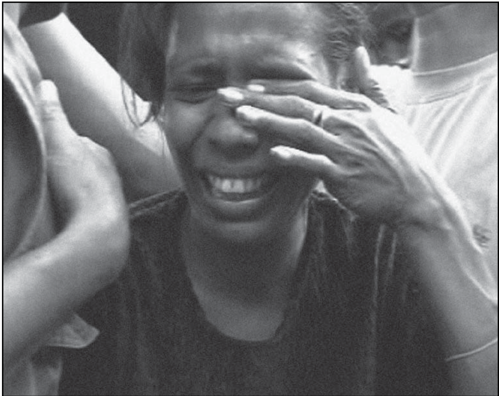
Iha sosiedade militar sempre iha violasaun kontre feto barakliu duke sosiedade baibain. Ida ne'e mak situaun ne'ebé feto Timor hasoru durante tinan 25 nia laran. Arkivo foto 1999.