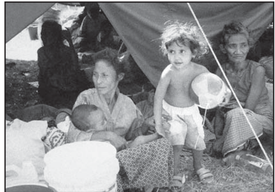
Arkivo foto 1999.