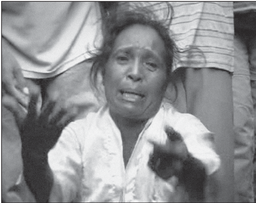
Arkivo foto 1999.