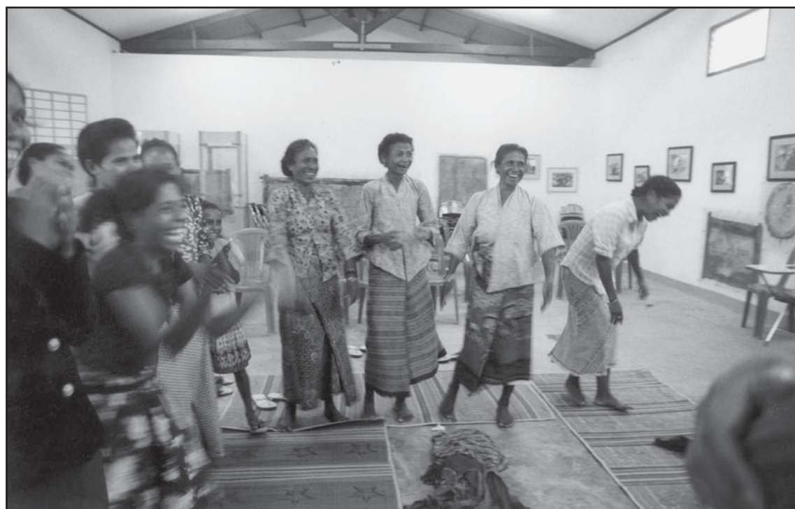
Arkivo foto 2004.