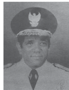
Mário Viegas Carrascalão hanesan governadór.

Ema sira ne'e mai iha ne'e, bele halo buat hotu. Buat hotu hanesan segredu.